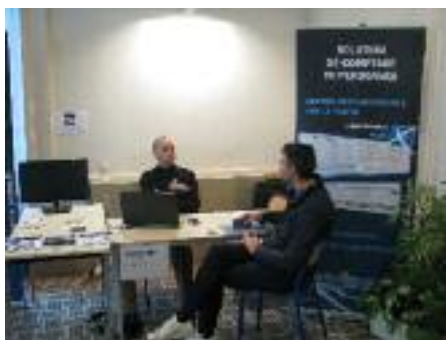
Axper, Axis et Theia Media étaient présents à la Journée E-entreprise pour présenter leurs solutions de vidéoprotection, comptage...

Adjudante Julia ROUSSELOT Groupement de Gendarmerie Départementale 1 Avenue Jean-Moulin - 90000 BELFORT. julia.rousseLOT@gendarmerie.interieur.gouv.fr Tél. 03 84 57 63 92 ou 06 15 58 51 88