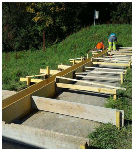
la Savoureuse n'a qu'à bien se tenir.

Le barrage en bois étant devenu obsolète, il a été décidé de le remplacer par un mur en béton de 38 mètres de long, de quoi contenir les turbulences et les colères de la rivière.